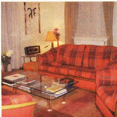
Le salon Terre et Feu est symbole de réputation au sud, d'amour au sud-ouest et de sagesse au nord-est, par rapport au nord symbolique qu'est votre porte d'entrée.

Le premier axe directeur du Feng Shui est la circulation de l'énergie, appelée Chi . Cette circulation doit pouvoir se faire de façon fluide. Tout ce qui freine ou entrave le mouvement du Chi est indirectement ou symboliquement un obstacle à notre réussite ou à notre santé. Une simple analyse et la réorganisation de ces mouvements permettent de comprendre la