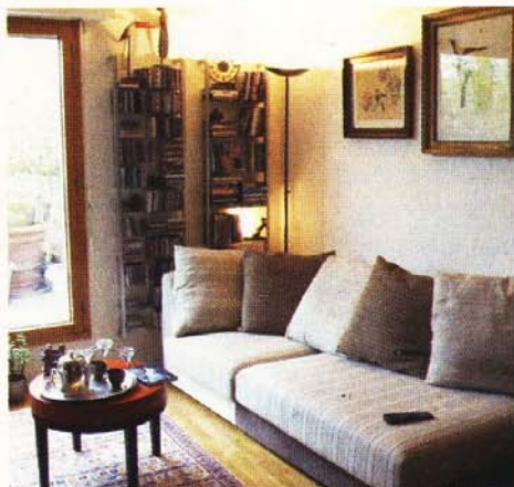
Salon Métal : situé à l'ouest par rapport au nord symbolique qu'est votre porte d'entrée, il symbolise les projets, au nord-ouest l'aide extérieure.

Tout l'art de Feng Shui visera à équilibrer ces cinq éléments dans les maisons en fonction des habitants. Comme dans notre vie quotidienne, ces éléments interagissent et se soutiennent mutuellement, ou se détruisent : un intérieur qui respecte le cycle de soutien sera